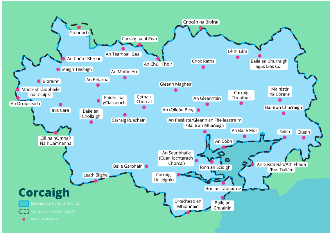
Fíor 1 Limistéar Staidéir Straitéise Fuíolluisce Chorcaí

Cuimsítear sa limistéar staidéir Mórcheantar Uirbeach Chorcaí agus Cuan Chorcaí agus dobharlaigh Chuan Lasmuigh Chorcaí sa Chreat-treoir Uisce.